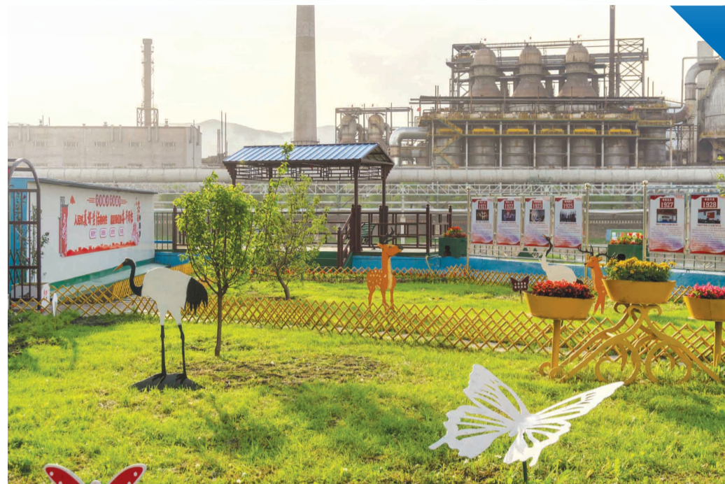
本钢北营炼铁总厂原料一作业区

花园式工厂建设只有进行时，没有完成时。在习近平生态文明思想指引下，新本钢正按照鞍钢集团的总体部署，积极承担起央企不断造福子孙后代的责任与担当，以“绿”为底，向“美”而行，持续推进国家“AAA”“AAAA”级旅游景区花园式工厂建设，用绿色低碳“丹青”不断绘就城企共融共生的美丽生态“画卷”，以行动和定力守护本溪这座“山水之城”！