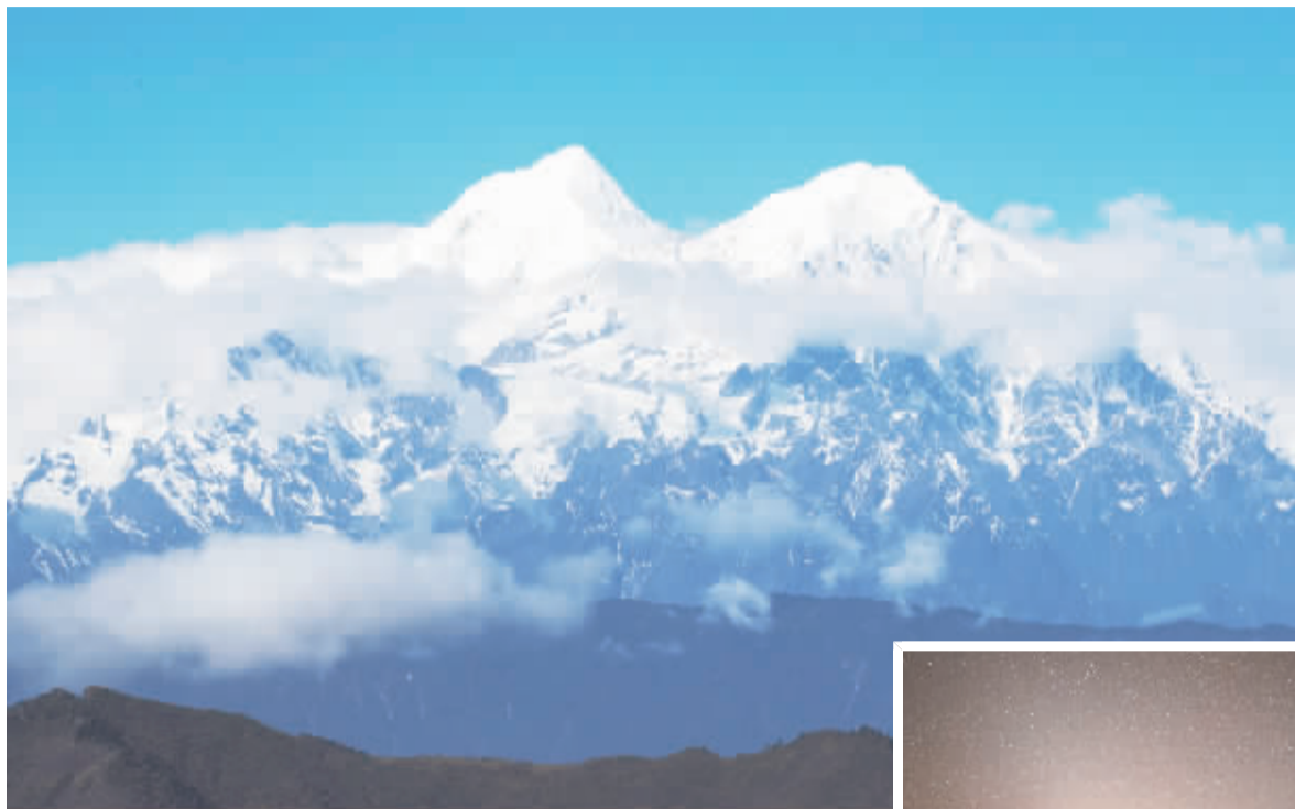
远眺贡嘎雪山,云雾缭绕。

四人同是一座山的名字,这座山坐落在四川省甘孜州泸定县冷碛镇,与雅安、康定相邻。登上这座山,才会真正的体验到什么是原始的味道:山上无水无电无信号,上山之后几乎与外界失去一切联系。