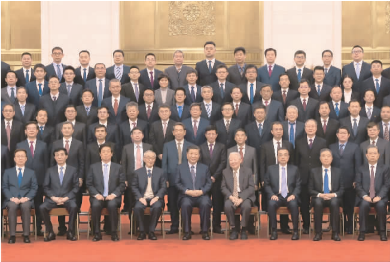
2月22日，党和国家领导人习近平、李克强、栗战书、汪洋、王沪宁、赵乐际、韩正等在北京人民大会堂会见探月工程嫦娥五号任务参研参试人员代表并参观月球样品和探月工程成果展览。这是习近平等会见探月工程嫦娥五号任务参研参试人员代表。